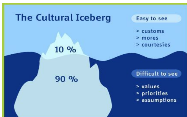
Slika 1: Kulturni ledeni brijeg. Grafika Regina Klein prema Edwardu T. Hallu, 1976

Studije slučaja najbolji su način za osnaživanje refleksivnosti, a s njom i transkulturnih prijelaznih vještina, posebno sposobnosti djelovanja u često nesigurnim, nepoznatim, dvosmislenim "trans-radnjama". Dobar slučaj predstavlja transkulturne i društvene činjenice tranzicijskog problema i pomaže čitateljima a/ da se uhvate u koštac s višeslojnim nijansama situacije, b/ da zarone dublje u transkulturnu vodu (Hall, 1976., vidi sliku 1), c / pronaći tranzicijske potencijale izvan još poznatih putova