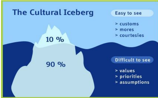
الشكل 1: الجبل الجليدي الثقافي. رسومات ريجينا كلاين بحسب إدوارد تي هول ، 1976

التصرف على القدرة وخاصة ، الثقافات عبر الانتقال مهارات ومعها الانعكاسية لتمكين طريقة أفضل هي الحالة دراسات والاجتماعية الثقافات عبر الحقائق الجيدة الحالة تقدم. الأحيان من كثير في وغامضة معروفة وغير غامضة "متداخلة إجراءات" في المياه في أعمق بشكل الغوص / ب ، للموقف الطبقات متعددة الدقيقة الفروق مع التعامل على / أ القراء وتساعد الانتقال لمشكلة الآن حتى المعروفة المسارات تتجاوز انتقالية إمكانات لإيجاد / ج ، (1 الشكل انظر ، Hall ، 1976 ،) الثقافات متعددة